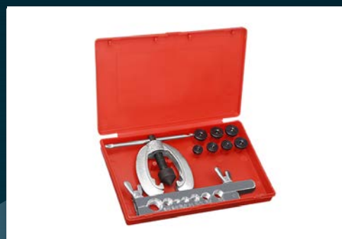
Podstawowy zestaw do zarabiania przewodów hamulcowych