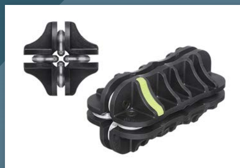
Prostownica ręczna dla rurki o średnicy 4,75mm

Zapraszamy do zapoznania się z listą dostępnych referencji na drugiej stronie ulotki oraz z aktualną ofertą produktów dostępną w katalogu eCar, w zakładce: