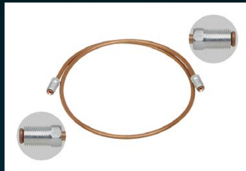
Przewód z końcówkami, pełny gwint zewnętrzny