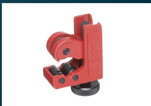
Mini obcinak do rur miedzianych